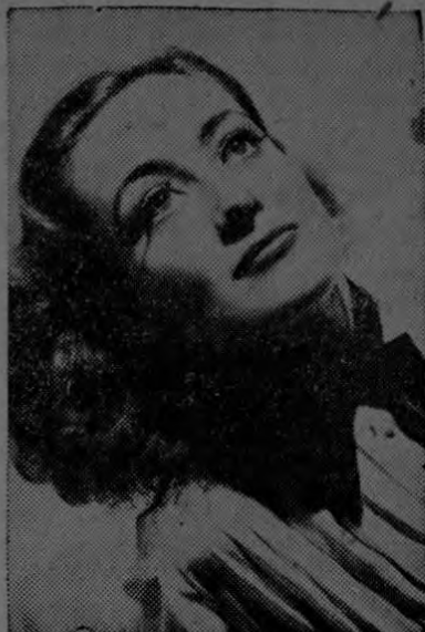
Las que tienen una tez tan fresca y seductora como la de Joan Crawford, pueden considerarla como "normal", declara el famoso experto de Hollywood, Max Factor Jr.

Claro que, desde el punto de vista de la belleza y atracción femeninas, el tipo de piel ideal es el "normal", es decir, el que no presenta ni exceso ni defecto de grasa. Y toda mujer que no tenga la suerte de que su cutis sea "normal", si de veras le interesa su salud y su buen parecer, debe seguir el tratamiento apropiado para su defecto físico.