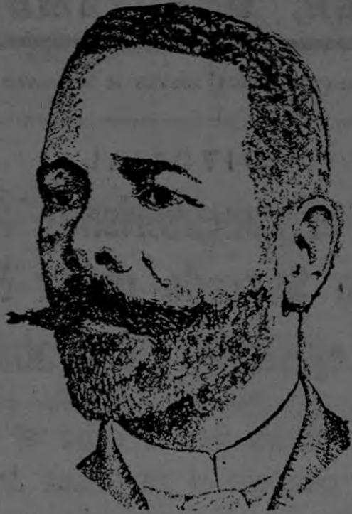
General Antonio Maceo